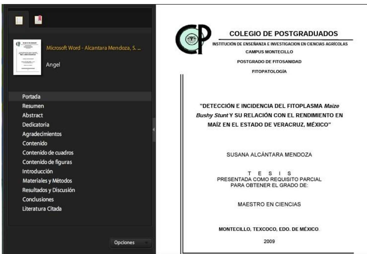
Figura 5. Marcadores de las partes principales de una tesis.

Se deberán entregar dos CDs o DVDs conteniendo en uno de ellos los archivos en los dos formatos antes citados, en otro sólo en formato PDF.