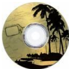
Figura 3. Disco impreso con tecnología LightScribe directamente con el lector grabador de discos.

Es deseable que los discos se presenten con carátula impresa a color en impresora láser, de inyección de tinta u otro medio, o en su defecto, a color sepia y negro (escala de grises) con la tecnología LightScribe, para lo cual se usan discos especiales disponibles en la mayoría de las tiendas de cómputo (Figura 3).