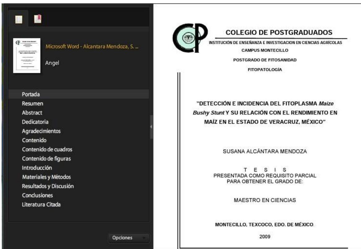
Figura 5. Marcadores de las partes principales de una tesis.

Se deberán entregar dos CDs o DVDs conteniendo en uno de ellos los archivos en los dos formatos antes citados, en otro sólo en formato PDF.