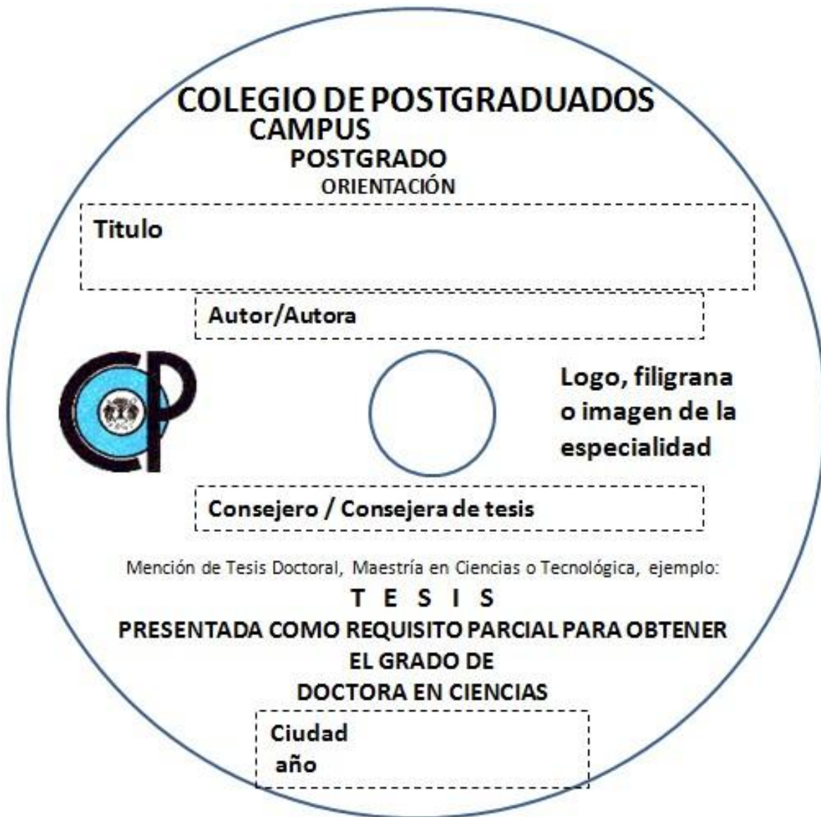
Figura 4. Formato de la impresión que debe llevar el CD o DVD que incluye la tesis.

Preferentemente el formato se debe imprimir sobre fondo claro pero se aceptan discos con imagen alusiva al tema de la tesis siempre y cuando no interfiera con la visibilidad de los datos.